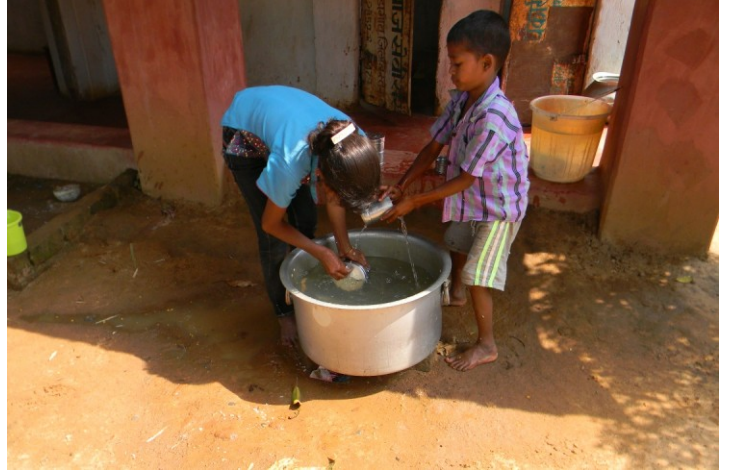
आदिवासी जीवनशैली बाँटने और सहयोग पर आधारित है

सहयोग की भावना की साफ़ झलक तब मिली जब स्कूल दो शिफ्टों की बजाये एक शिफ्ट में लगना शुरू हुआ. जब स्कूल दो शिफ्ट चलता था तब सभी बच्चों को स्कूल में दोपहर का खाना दिया जाता था. पर जब सब बच्चे एक साथ आने लगे तब 60 बच्चों के लिए स्कूल में एकसाथ भोजन पकाना संभव नहीं था. इस मुद्दे पर चर्चा हुई और कुछ बच्चे घर से खाना लाने के लिए राज़ी हो गए. पर कुछ बच्चों के लिए घर से खाना लाना संभव नहीं था. चर्चा के दौरान कई व्यस्क और बच्चे अपने घरों से बाकी बच्चों के लिए ज्यादा खाना लाने को तैयार हो गए. स्कूल में भी कुछ ज्यादा भोजन बनाया जाने लगा जिससे की सभी बच्चों को भोजन मिल सके.